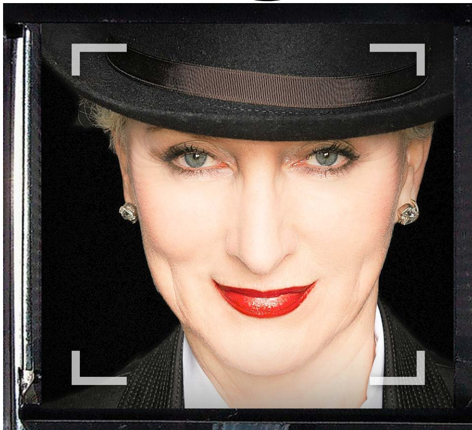
Sie erzählt so beschwingt von der Frühzeit des Tangos, dass man glaubt, seine Klänge zu hören.

Dann erzählt die Dame von jungen Frauen aus ganz Europa, den Schweizer Bergen oder Süddeutschland, die in den 30er-Jahren der Armut entfliehen wollten und von Agenten nach Argentinien verschifft werden – heute würde man diese Profiteure der Armut Schlepper nennen.